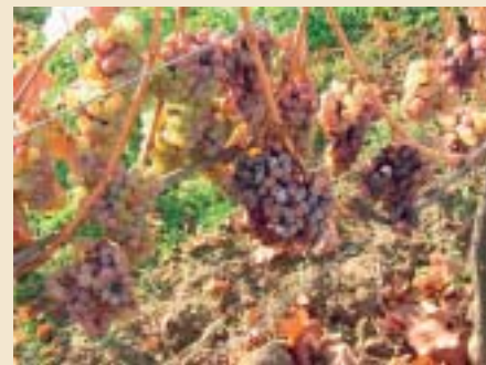
Edelfaule Trauben am Rebstock

Eisweine sind eine weitere Art von edelsüßen Weinen, die auf die Launen der Natur angewiesen sind. Es muss sehr kalt sein, für diese Weinart, denn erst bei Temperaturen von mindestens 7 Grad unter dem Gefrierpunkt sind die Trauben so richtig hart gefroren. Durch den Frost trennen sich die Inhaltsstoffe in der Beere und beim anschließenden Pressen bleibt in der Kelter reichlich gefrorenes Wasser zurück. Zucker, Säuren und Extraktstoffe werden auf diese Weise konzentriert. Eisweine kommen aus Österreich und Deutschland, im italienischen Weingesetz sind sie nicht vorgesehen.