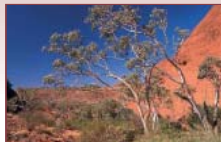
Dieses Bild ist ein weiteres Beispiel für die bestimmenden Farben im Red Centre. Roter Fels, rote bis gelbe Erde, blauer Himmel, weißstämmige Bäume und grüne Blätter. Und nicht zuletzt Gott sei Dank auch ab und zu etwas schwarzer Schatten ;-)