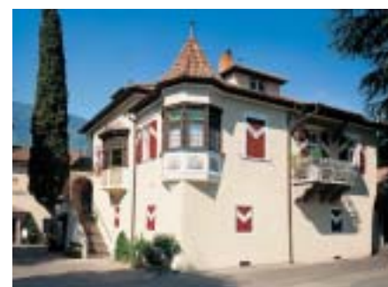
Die Meraner Kellerei befindet sich in unmittelbarer Nähe zur herrlichen Meraner Altstadt, gleich bei der Maria-Trost-Kirche.