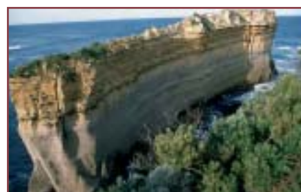
Victoria: The Wall (die Wand).