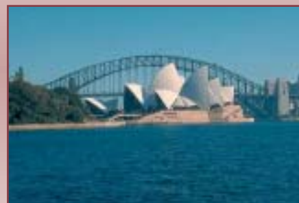
Blick von der Nordostspitze des Botanischen Gartens auf das Opera House und die Sydney Harbour Bridge.

Australien ist mit 19.913.144 (July 2004 est.) Einwohnern auch der bevölkerungsärmste Kontinent (weniger als Polen). Im Australischen Bund und Neuseeland ist die Mehrheit der Bevölkerung britischstämmig. Die Ureinwohner des Staates Australien - die Aborigines und die Tasmanier - stellen nur noch wenige Prozent der Einwohnerzahl bzw. sind vollständig ausgestorben, während die Maori - die Ureinwohner Neuseelands - bis heute 10% der Gesamtbevölkerung stellen. Von wachsender Bedeutung ist der asiatischstämmige Bevölkerungsanteil. Die Bevölkerung der Inseln ist zum Teil stark gemischt. Indigene Völker Australiens-Ozeaniens sind neben eingewanderten Europäern vor allem auf den heute unabhängigen Inseln in der Mehrheit.